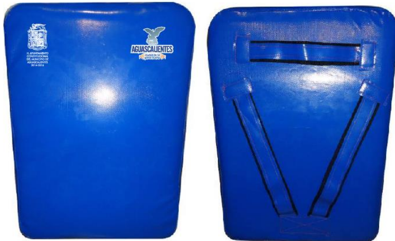
REQ 70302-26 DOMIS PARA PATEO