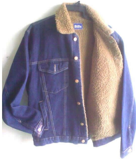
REQ 90302-310 Y 90303-53 CHAMARRA AZUL CON BORREGO.