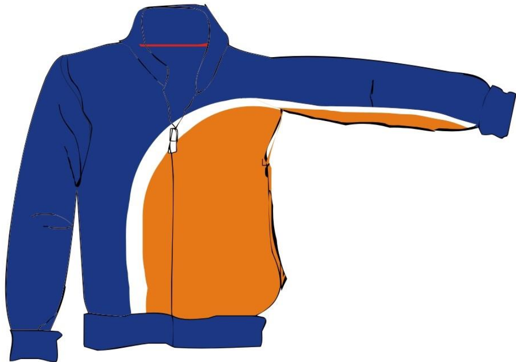
REQ. 90701-11 CHAMARRA AZUL CON FRANJA BLANCA Y AMARILLO